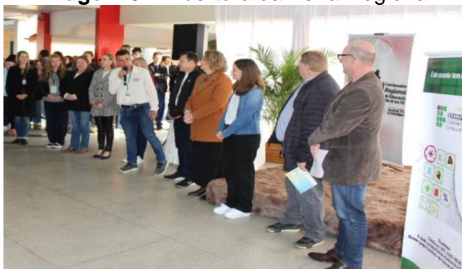
Imagem 04: Abertura da Feira Regional

Com praticamente tudo organizado no dia 16 de agosto, na cidade de Braço do Trombudo, nas dependências da Escola de Educação Básica Adolfo Böving aconteceu o evento que desde o início do ano vinha sendo planejado. A abertura aconteceu por volta das 8h e 30 min. com a presença de autoridades, alunos, expositores, professores, orientadores, comunidade escolar e comunidade em geral.