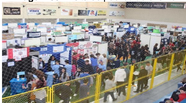
Imagem 05: Visita do público ao evento.

Durante o dia houve apresentações, socializações, muito conhecimento compartilhado e muita visitação por parte de alunos, pais e sociedade. Toda a equipe organizadora também estava dando apoio em diversas situações para que tudo ocorresse do melhor modo possível, além disso, observou-se uma participação de toda a comunidade durante o evento com intuito de ajudar e proporcionar um dia inesquecível para todos, nesse sentido observa-se que este fato vem ao encontro de uma gestão democrática que “[...] tem como base a participação efetiva de todos os segmentos da comunidade escolar, o respeito às normas coletivamente construídas para os processos de tomada de decisões e a garantia de amplo acesso às informações aos sujeitos da escola”. (Souza, 2009, p.126). Esta participação pode ser vista na imagem abaixo: